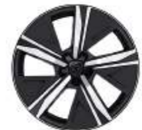
Aluminum wheel rim 18" KAMAKURA (GT)