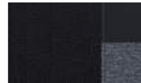
"Falgo" Mi-TEP 미스트랄/패브릭 (Allure 모델 적용)

* 옵션으로 제공 - 가죽 및 기타 직물 : 가죽에 대한 자세한 내용은 구매 시 또는 웹 사이트에서 제공되는 기술 사양을 참조하십시오.