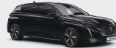
페라 네라 블랙 (Perla Nera Black)