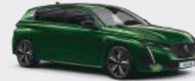
올리빈 그린 (Olivine Green)