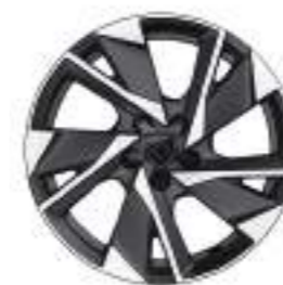
Aluminum wheel rim 17" HALONG (Allure)