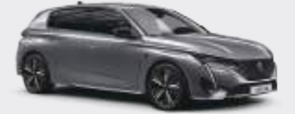
큐물러스 그레이 (Cumulus Grey)