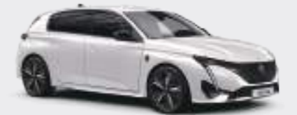
펄리 화이트 (Pearly white)