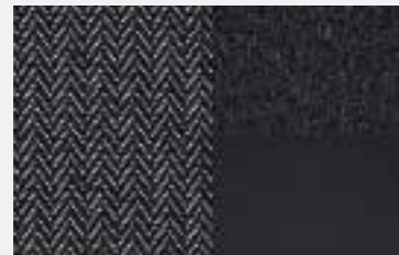
Colyn Fabric with Mint Green Stitch (Allure)