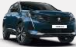
셀레브스 블루 (Celebes Blue)