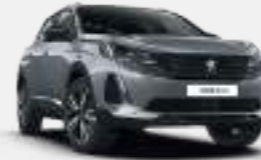
아텐스 그레이 (Artense Grey)