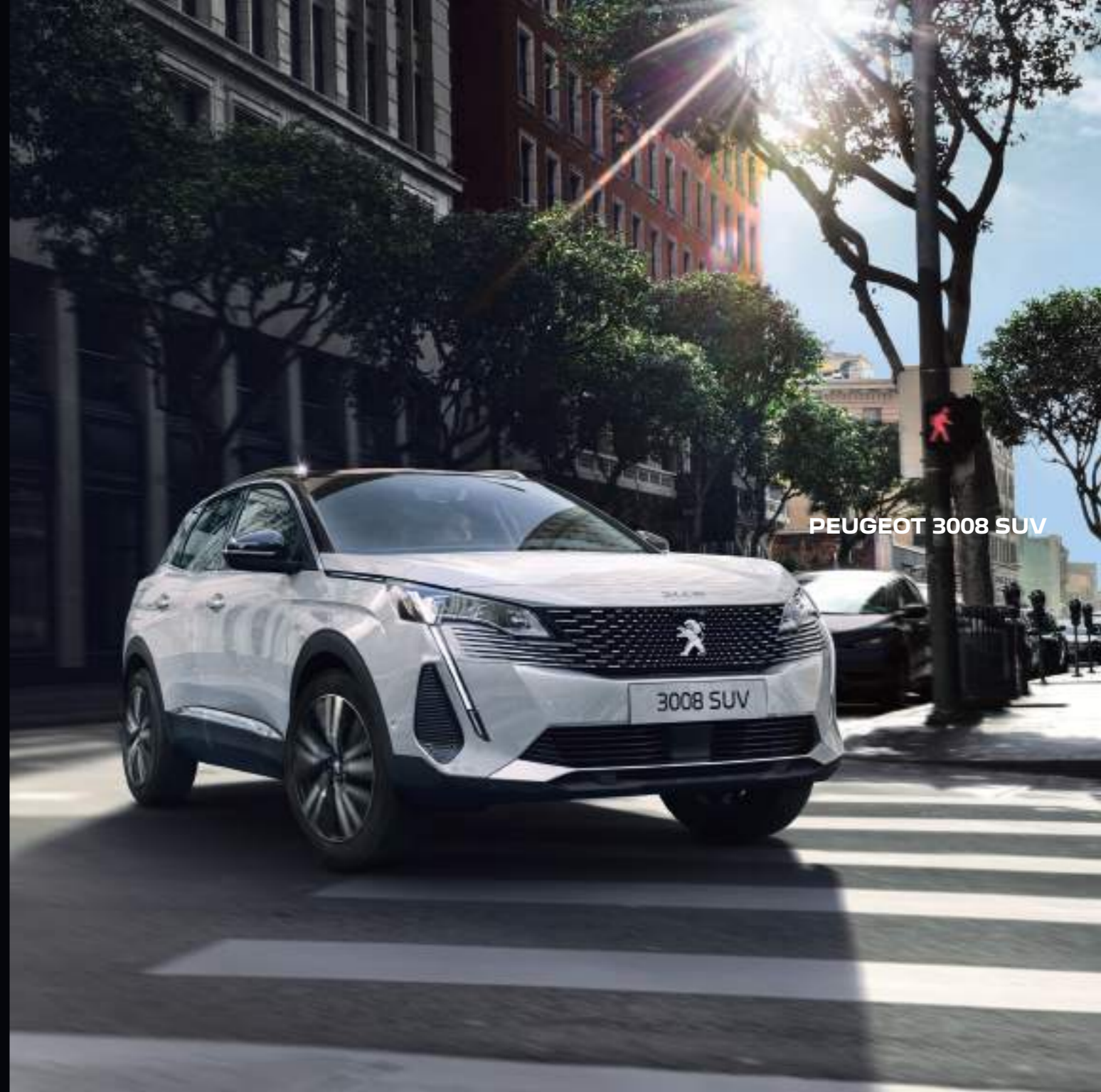
PEUGEOT 3008 SUV