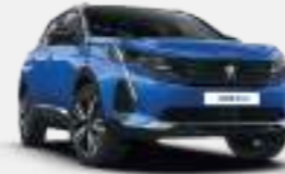
버티고 블루 (Vertigo Blue)