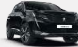
네라 블랙 (Nera Black)