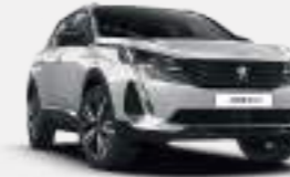
펄 화이트 (Pearl White)