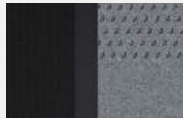
Nappa Leather with Tramontane Stitch (GT PACK)