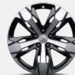
18" 'LOS ANGELES' Diamond Alloy Wheels (GT / GT PACK)