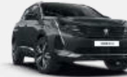
님버스 그레이 (Nimbus Grey)