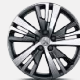
18" DETROIT Diamond Alloy Wheels (Allure)