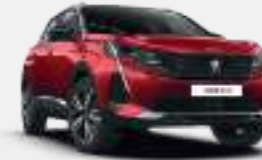
얼티메이트 레드 (Ultimate Red)