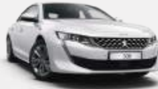
펄 화이트 (Pearl White)