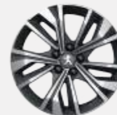
17" 'MERION' diamond-cut two tone (Allure)