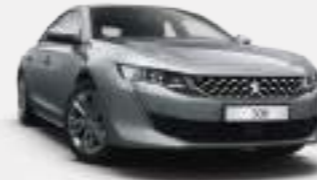
큐물러스 그레이 (Cumulus Grey)