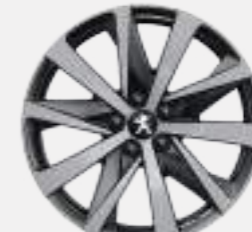
18" 'HIRONE' diamond-cut two tone with tinted varnish (GT)