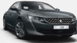
허리케인 그레이 (Hurricane Grey)