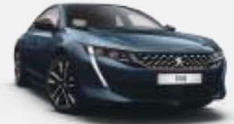
셀레브스 블루 (Celebes Blue)