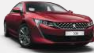
얼티메이트 레드 (Ultimate Red)