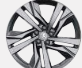
19" 'AUGUSTA' diamond-cut two tone (GT PACK)