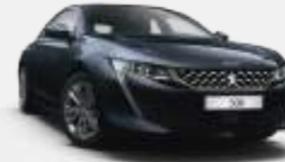
트와일라잇 블루 (Twilight Blue)