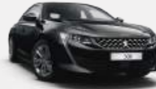
네라 블랙 (Nera Black)