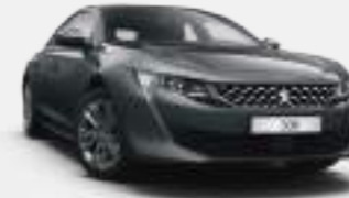
넘버스 그레이 (Nimbus Grey)