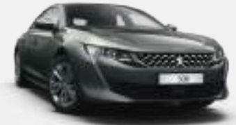
스마트 그레이 (Smart Grey)