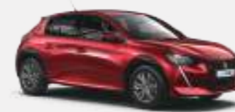
엘릭서 레드 (Elixir Red)