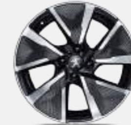
17" 'SHAW' ALLOY WHEELS