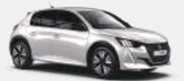
펄 화이트 (Pearl White)