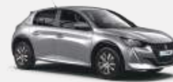
큐물러스 그레이 (Cumulus Grey)