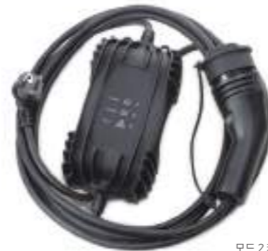
모드 2 케이블