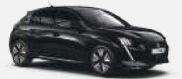
네라 블랙 (Nera Black)