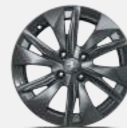
16" 'ELBORN' ALLOY WHEELS