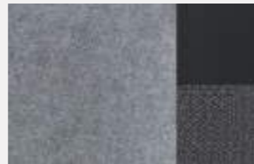
TRI-MATERIAL GREY ALCANTARA® AND CLOTH SEAT TRIM (GT, OPTION)