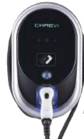
푸조 월박스 (벽걸이)