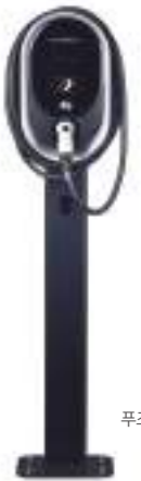
푸조 월박스 (스탠드)