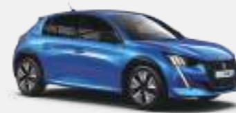
버티고 블루 (Vertigo Blue)