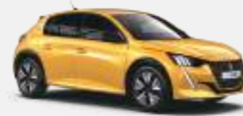
페로 옐로우 (Faro Yellow)