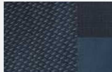
Tri-material 'Traxx' leather effect and 'Isabella' cloth seat (Allure)